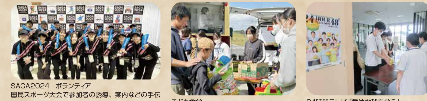
SAGA2024 ボランティア 国民スポーツ大会で参加者の誘導、案内などの手伝いをしました。