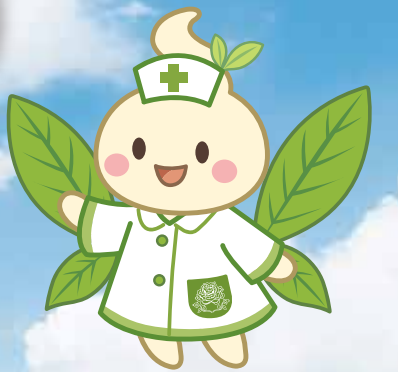
マスコットキャラクター ゆのは (湯の葉)